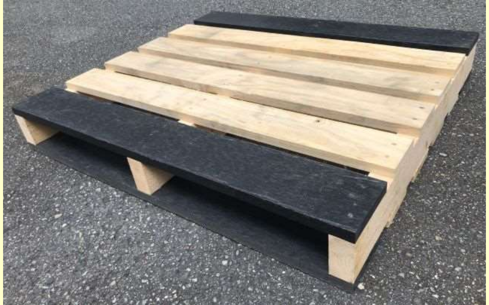
上記写真例：1000×1000パレット